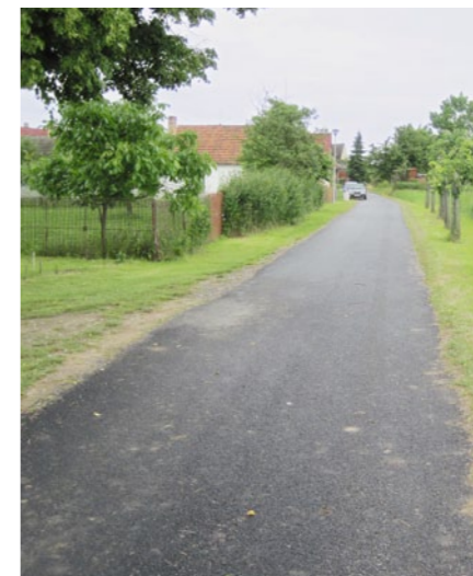
Místní komunikace v Krakovčích.