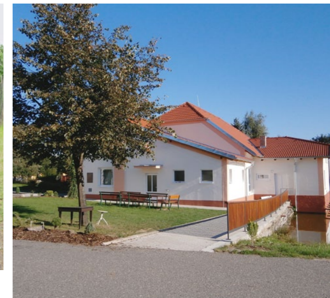
Kulturní dům v Předčích.