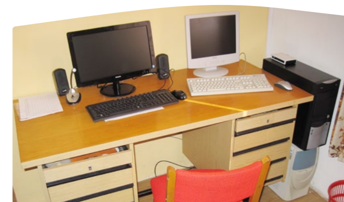
Bezdrátová rozhlasová stanice v Horních Kněžekladech.

Možná i tímto úspěšným projektem se pak nechala inspirovat obec Temelín, která na podzim loňského roku také vybavila všechny části obce veřejným bezdrátovým rozhlasem. Vzhledem k rozloze obce a počtu všech jejích částí a osad bylo nutné kromě ústředny pořídit celkem 39 výkonových hnízd, na kterých je umístěno celkem 84 reproduktorů. To se však i s pomocí dotace z Leaderu ve výši cca 439 tis. Kč podařilo.