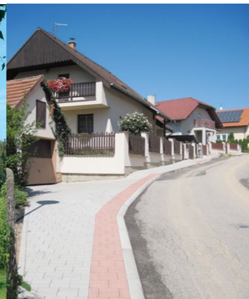
Nový chodník v Dolním Bukovsku.

4 / Nezemědělní podnikatelé / 1 037 715 Kč / 5%